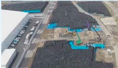
写真(左) irumamusashisanpo.cocolog-nifty.com (右) blog.livedoor.jp/gataroclone/archives/43696907.html より引用

環境省は、2016年6月30日、福島県内で発生した除染廃棄物最大2200万m 3 (東京ドーム18杯分)のうち、1キロあたり8000ベクレル以下(最大45%)を、人為的な掘り起こしのない道路や防潮堤の建築資材として再利用する方針を正式決定。